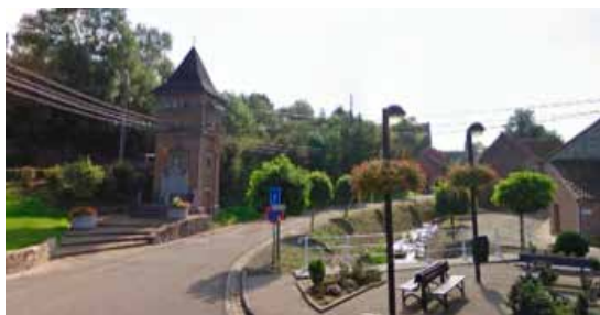
Cabine-tour de Mortroux

Ces cabines se situent d'une part, près du n° 3 de la rue Davipont à Mortroux (12 m 2 ) (il est important de noter que le Monument aux Morts se trouve à proximité) – parcelle cadastrée 7e division, section A, n° 573A2 – et d'autre part, à proximité du n° 2 de la rue Lieutenant Pirard de Dalhem (16 m 2 ) – 1 re division, section A, n° 177/2.