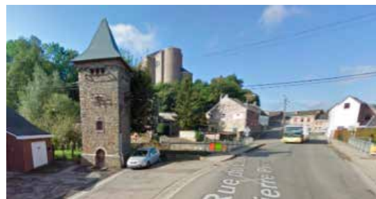
Cabine-tour de Dalhem

Nous vous remercions d'avance pour l'intérêt que vous accorderez à ce projet!