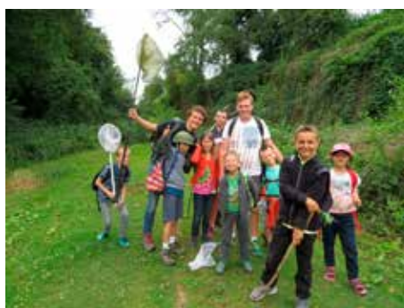
Stage de pêche ▶

Comme chaque année, les stages ont rassemblé des dizaines d'enfants et ont rencontré un franc succès!