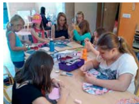
▼ Stage de couture