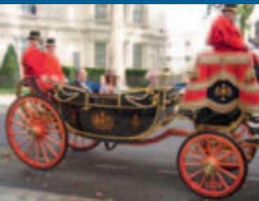
En partance pour la présentation de mes lettres de créance à la Reine Elizabeth