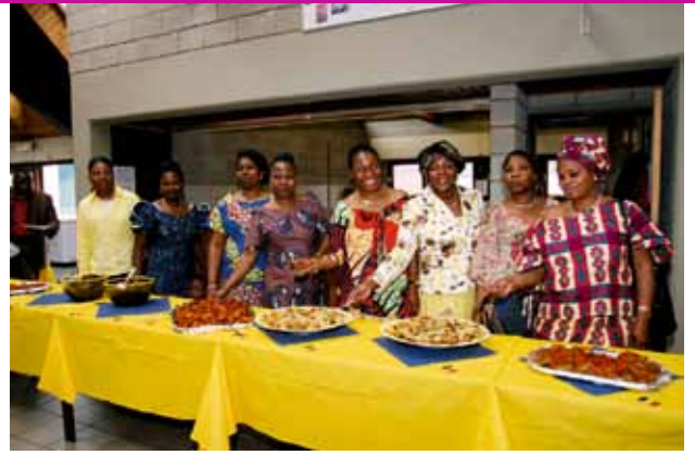
Souvenir du 4 juin 2005