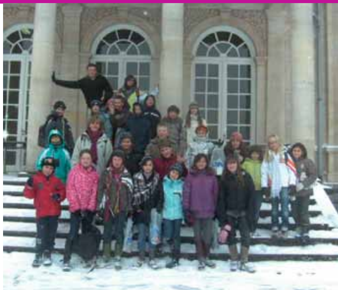
Les élèves de 5 e année de l'école de Dalhem.

Mi-février, grande effervescence à Dalhem. La classe de 5 e année se préparait à partir en classes vertes au domaine de La Fraineuse à Spa. Notre séjour nous a permis d'allier le sport et la nature. Chaque matinée était réservée à une visite d'ordre pédagogique comme la découverte du Musée de la Forêt par exemple. Par contre, l'après-midi était consacrée à différents sports: nous avons apprécié le ski de fond, découvert le blast-ball ... En début de soirée, madame nous accueillait en classe pour exploiter notre visite du matin et terminer la journée en beauté avec des jeux d'équipes ou autres. Que de découvertes intéressantes, que de plaisirs partagés, que d'amusements au cours de cette semaine où la neige était elle aussi de la partie !