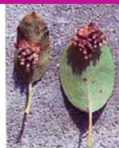
Symptômes sur les deux faces de feuilles

Antérieurement, en séance du 22/11/05, une disposition communale avait déjà été adoptée, interdisant toute plantation de genévrier dans les nouveaux lotissements et parcelles constructibles de l'entité. Dorénavant d'autres variétés ornementales compatibles avec nos espèces locales pourront être conseillées en remplacement.