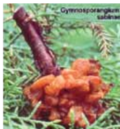
Photo 3 : Symptômes en mai-juin sur genévrier. Photo 4 : Symptômes en juillet-avril sur genévrier.

Par ailleurs – et cela est très important – un appel pressant à la vigilance et à la responsabilité est adressé à tous. En effet, le vecteur de cette maladie est un champignon qui prospère sur le genévrier – arbuste exotique naguère en vogue - qui orne tant nos jardins. Les spores de ce champignon, emportés par le vent, ont un rayon de dissémination estimé à plusieurs centaines de mètres, voire, dans certains cas, à plus d'un kilomètre. On le comprendra aisément, la lutte contre la rouille grillagée doit passer par des mesures radicales telles que l'élimination systématique et la destruction par le feu des plants infestés.